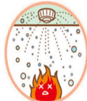
スプリンクラー設備