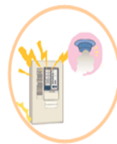
自動火災報知設備