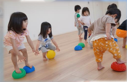
バランスボールでバランス感覚を養います