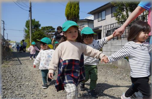
お散歩を通して体力がつかます

※初めはサッカーの基本的なルール「手を使わない」という事にはこだわらず「楽しくボールで遊ぶ」ということを大切にしています。