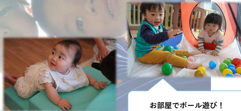
お部屋でボール遊び！