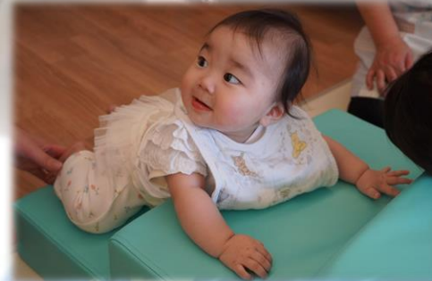
プレイロックで運動機能の向上