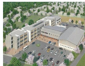
改築中の福島養護学校