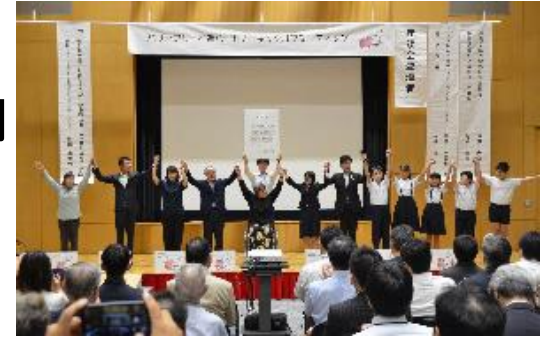
バリアフリーパートナーミーティング