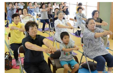
体操に取り組む石合南・北町内会の皆さん