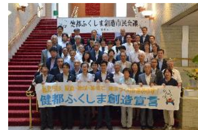
健都ふくしま創造市民会議