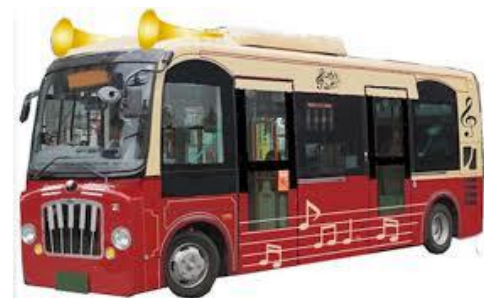
メロディーバスのイメージ