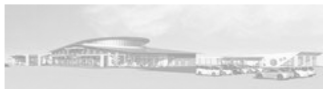
(仮称)道の駅ふくしま 令和4年春開業予定

産業・観光の振興をはじめ、まちのにぎわいと活力の創出を進めるとともに、東京2020オリンピック・パラリンピックを契機としたまちづくりに取り組みました。